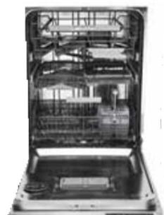
D5556XL FI, XL 82 cm Type: volledig geïntegreerd