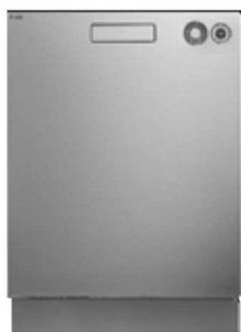
D5436, XL 82 cm Type: onderbouw