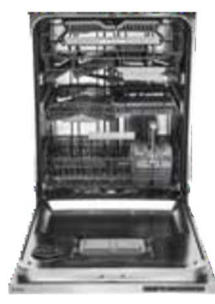
D5566XXL FI, XXL 86cm Type: volledig geïntegreerd