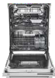
D5896XXL FI, XXL 86 cm Type: volledig geïntegreerd