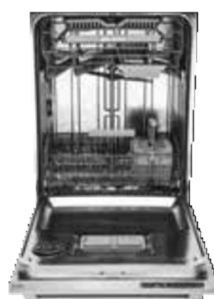
D5546XL FI, XL 82 cm Type: volledig geïntegreerd