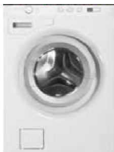
W Sweden Edition Type: vrijstaand