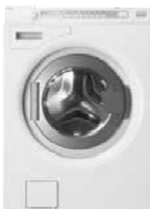
W8844XL ECO Type: vrijstaand