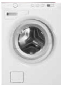
Malmö Type: vrijstaand