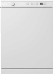
T754 Type: vrijstaand, afvoerdroger