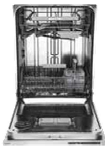
D5536XL FI, XL 82 cm Type: volledig geïntegreerd