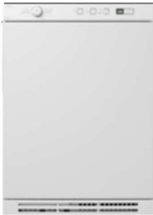
T756HP Type: vrijstaand, warmtepompdroger