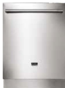
Pro Series™ rvs deur