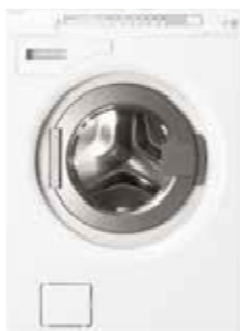
W6884 ECO Type: vrijstaand