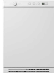
T754HP Type: vrijstaand, warmtepompdroger