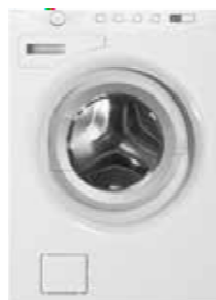
W6564NL Type: vrijstaand